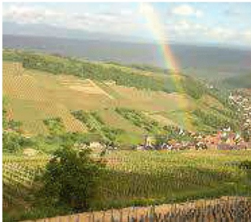
Vinhedo do Domaine Rominger

É no Alto-Reno que são produzidos melhores vinhos da região. O clima é mais seco devido à altitude das montanhas Vosges, que protege as vinhas das tempestades do Atlântico. Quanto mais próximas das montanhas Vosges, mais íngremes se tornam as encostas e conseqüentemente os vinhedos: desta forma se originam Rieslings complexos, ricos e potentes.