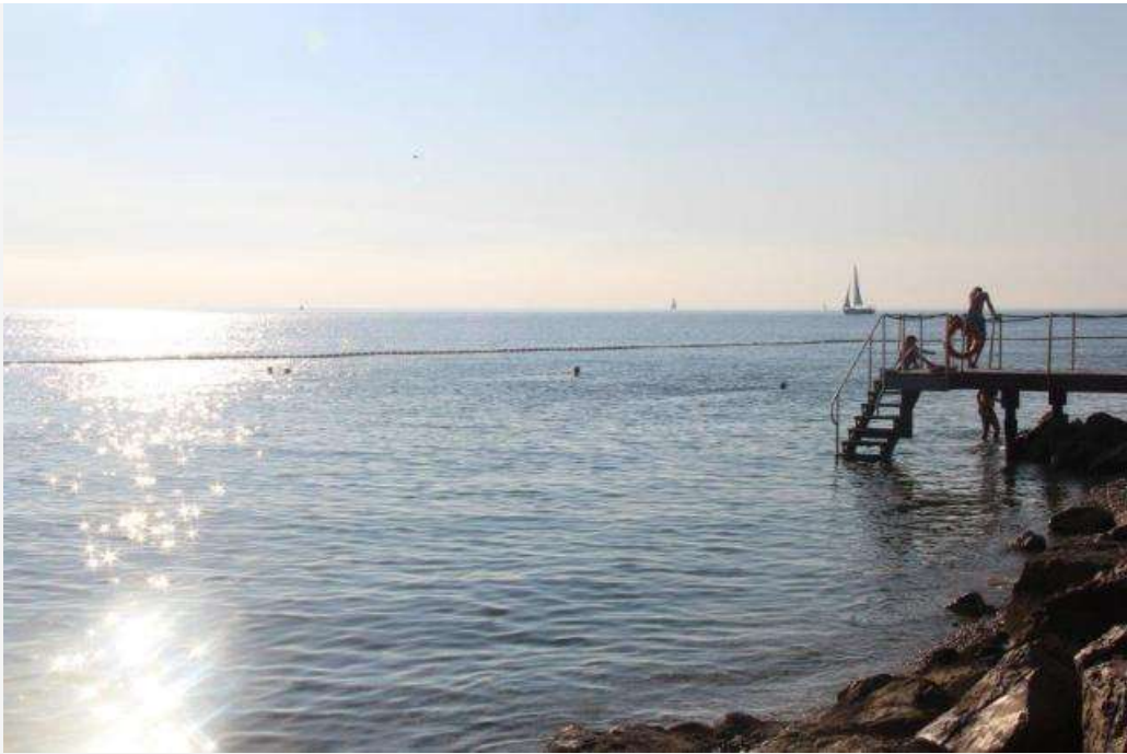
Praia em Portoroz.

Para cair no mar, o melhor é caminhar até Portoroz (aproximadamente 15 minutos), onde você encontrará alguns restaurantes a metros da praia e um hotel com “day use” onde você paga 15 euros para passar o dia, com direito à cadeira e guarda-sol e uso dos chuveiros e outras instalações. Passei somente um dia entre Piran e Portoroz, mas fiquei com vontade de voltar e explorar melhor a costa! Também ficou atizado? Leia mais mais sobre outras cidades costeiras na Eslovênia aqui (em inglês).