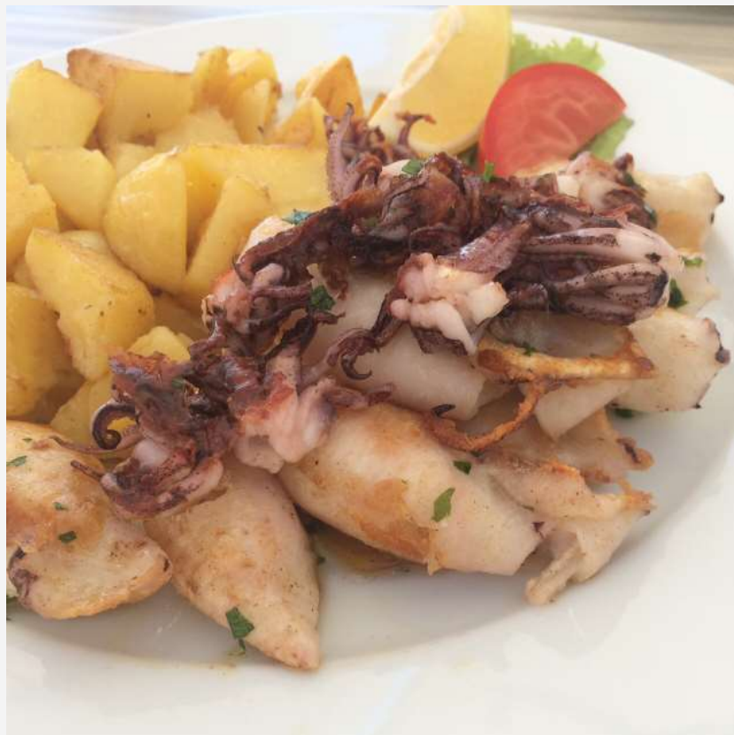
Delicioso prato com lula em restaurante de Portoroz (por 10 euros!)