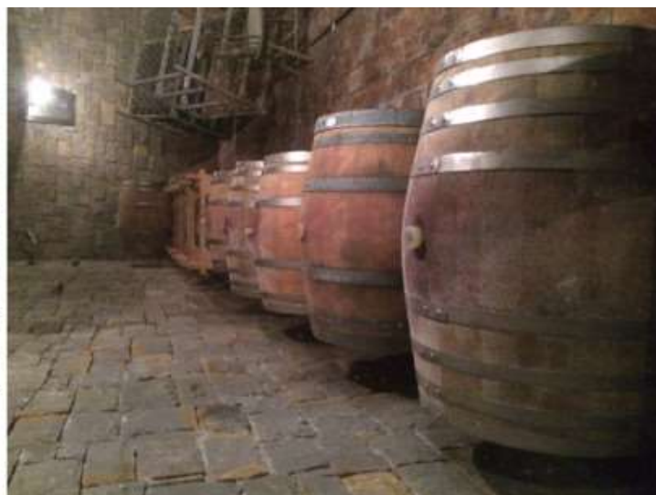
Produção de Rebula, um vinho típico esloveno