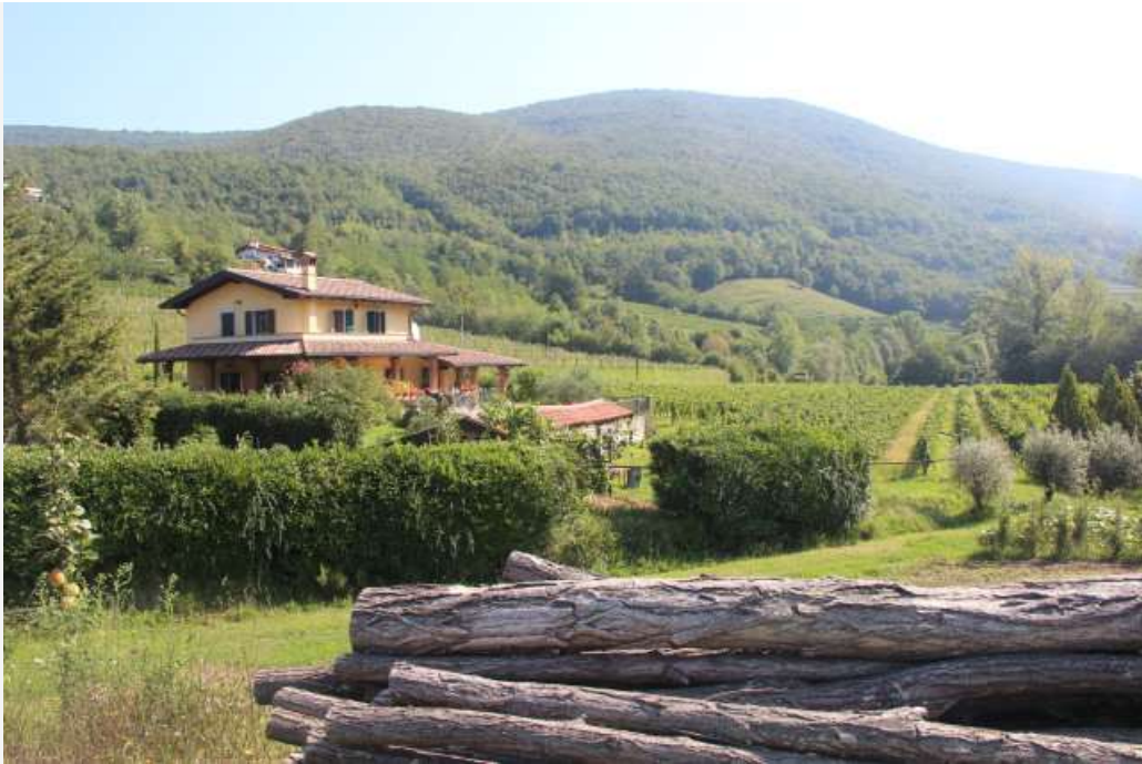
A Vin cola Valentincic na regi o de Brda

Eu e uma amiga ficamos na Guest House Valentincic , que é administrada por uma família muito querida que se orgulha de produzir vinho há gerações. A casa principal, onde estão os quartos, possui uma adega aberta à visitaç o onde provamos tr s  timos vinhos! D  para visitar os vinhedos, colher uva na  poca da fruta e se deliciar com o fant stico caf -da-manh  preparado com produtos locais e fresquinhos. Comemos at  dar c imbra e valeu a pena! Hehehe. (Leia mais sobre os vinhos dessa boutique winery aqui ). Como Brda fica a minutos da It lia, voc  pode dar uma esticadinha at  o pa s vizinho, caso o destino esteja nos seus planos.