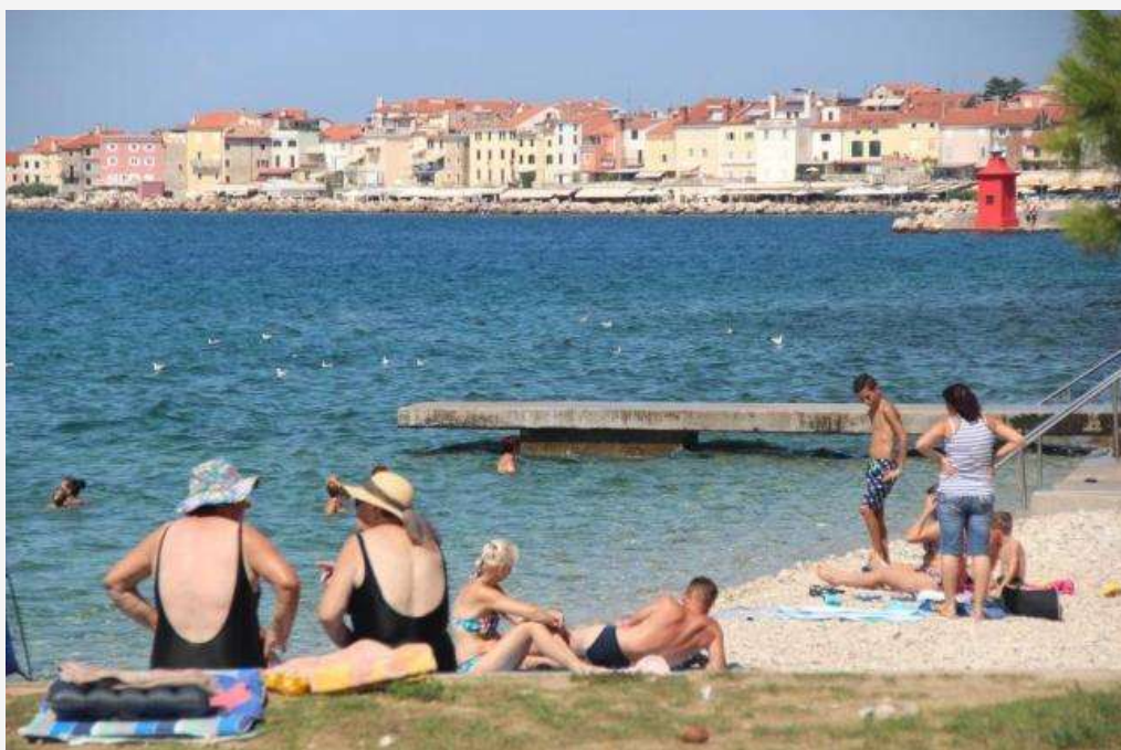
Faixa de "areia" em Piran