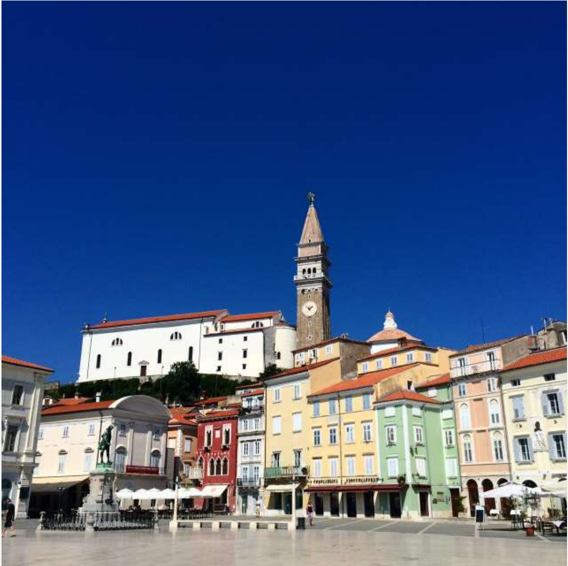
Centro histórico de Piran